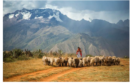
Valle Sagrado de los Incas