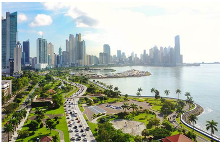
Ciudad de Panamá