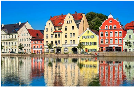
Saint Wolfgang Im Salzkammergut