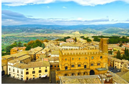
Castiglione del Lago