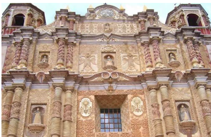
San Cristóbal De Las Casas