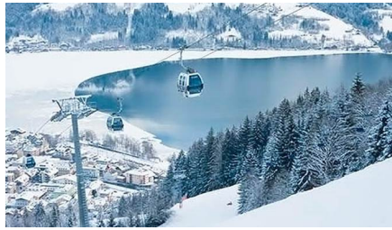
Feldkirchen In Karnten