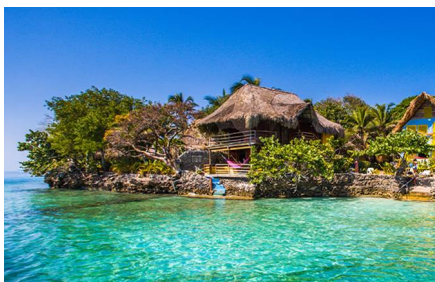
Islas del Rosario