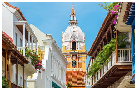
Cartagena De Indias