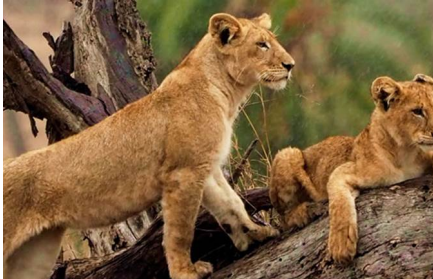
Parque Nacional del Serengueti