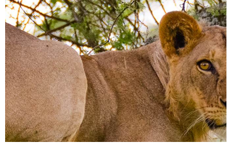
Parque Nacional de Tarangiree