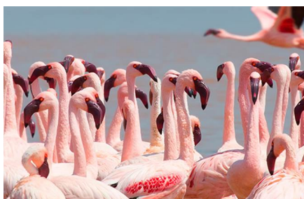
Lake Naivasha National Park