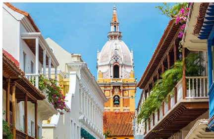
Cartagena De Indias