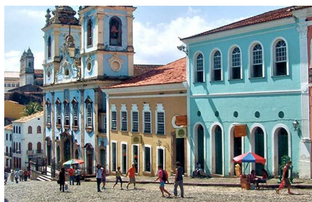
Salvador de Bahía