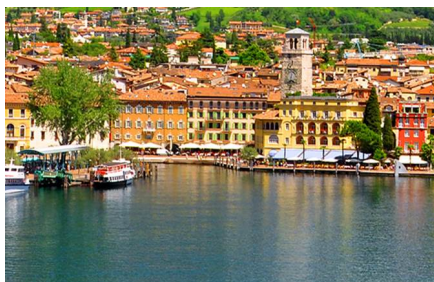
Riva del Garda