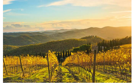
Radda in Chianti