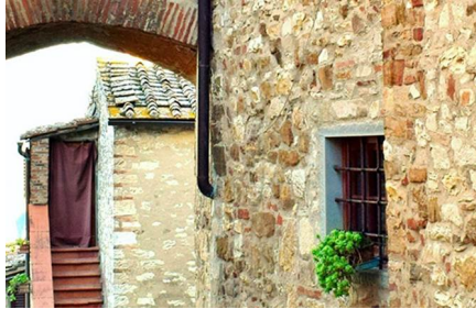
Greve In Chianti