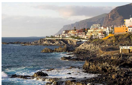
Puerto de Santiago - los Gigantes