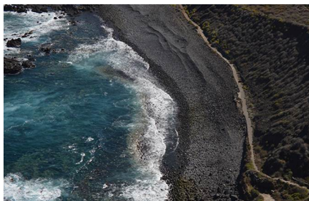
Buenavista Del Norte