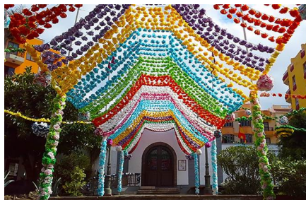
Icod De Los Vinos