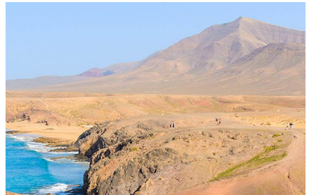
Costa de Papagayo