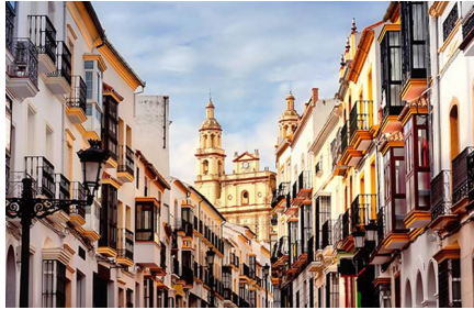
Sanlúcar De Barrameda