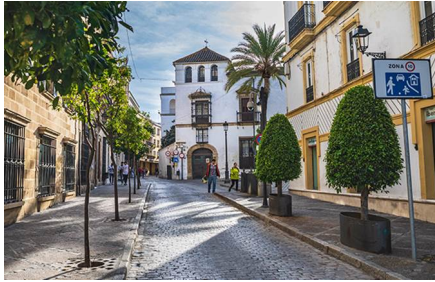
El Puerto De Santa María