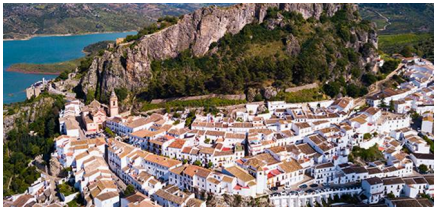
Jerez de la Frontera