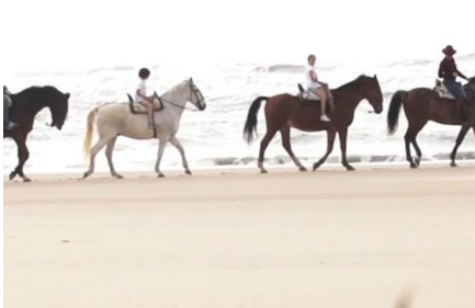
Parque Nacional de Doñana