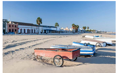
Sanlúcar De Barrameda