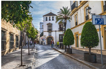
Jerez de la Frontera