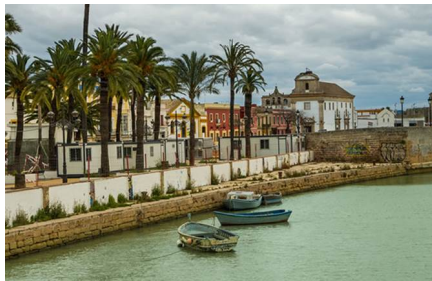
El Puerto De Santa María