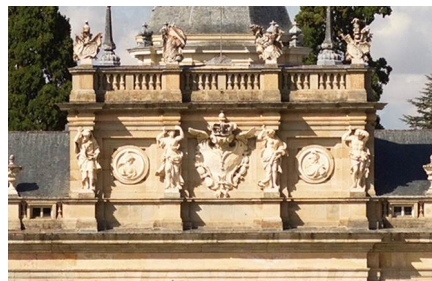
La Granja De San Ildefonso