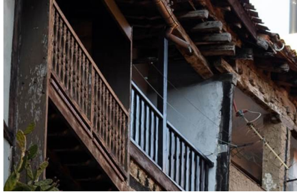
San Esteban De La Sierra