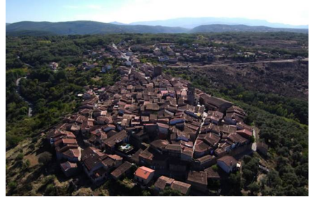
Miranda del Castañar