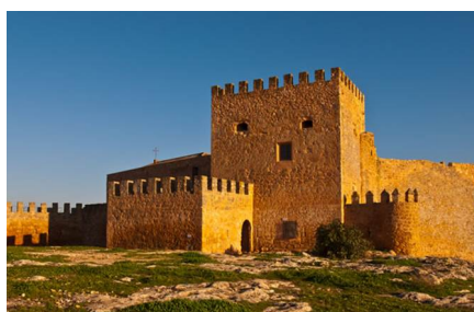
Argamasilla De Alba