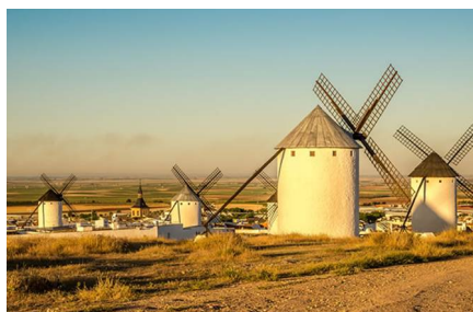
Campo De Criptana