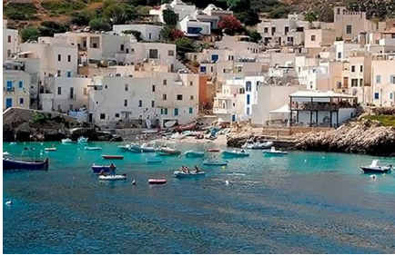
Mazara del Vallo