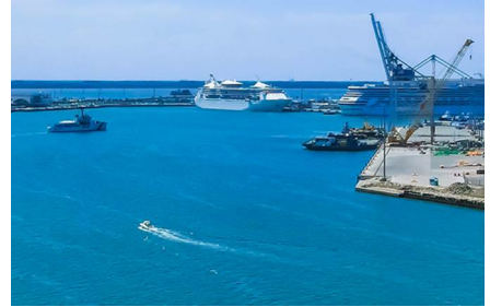
Cabo Cañaveral - Fl