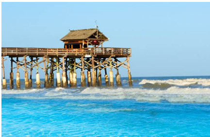
Cocoa Beach - Fl