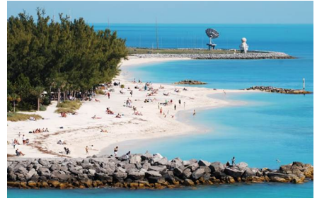
Key West - Fl