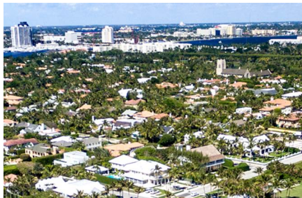
Palm Beach - Fl