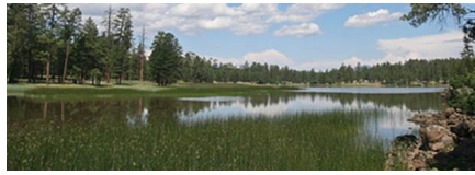
Kingman - Az