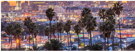
Monterey - Ca