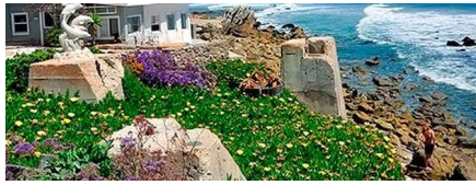
Gilroy - Ca