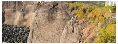
Cupertino - Ca