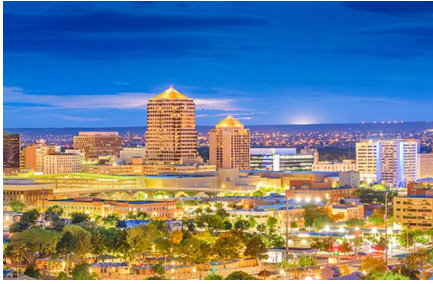
Albuquerque - Nm