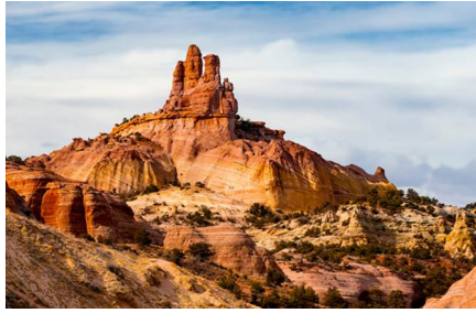
Gallup - Nm