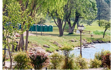
Ruidoso - Nm