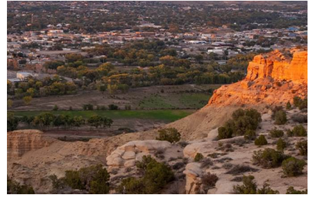
Farmington - Nm