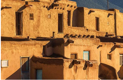
Taos - Nm