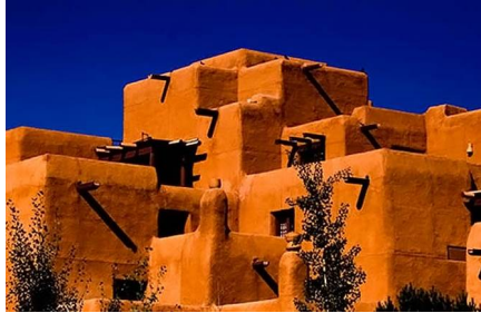
Santa Fe - Nm