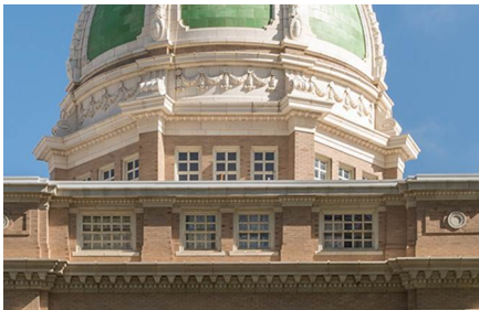
Roswell - Nm