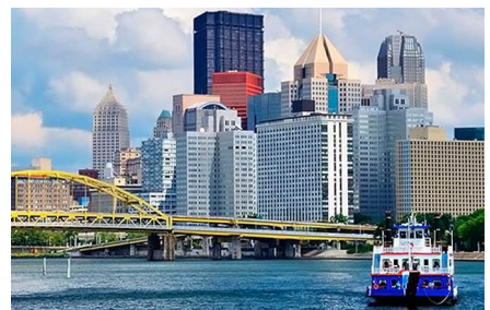
Pittsburgh - Pa