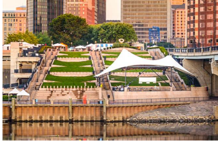
Hartford - Ct