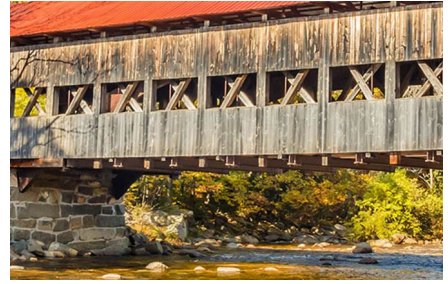
Conway - Nh