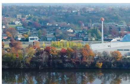
Springfield - Ma