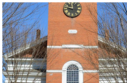
Burlington - Vt