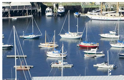
Bar Harbor - Me