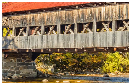
Conway - Nh