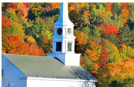
Stowe - Vt