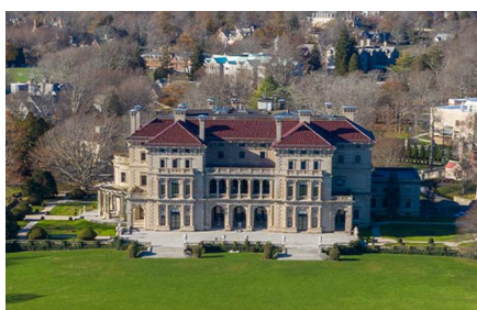
Newport - Ri