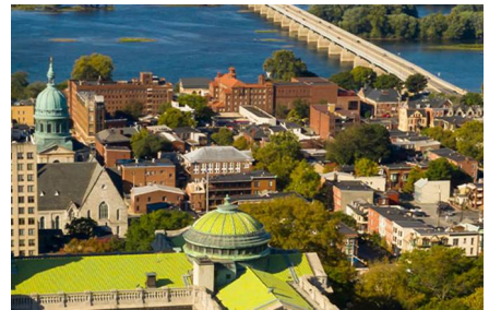
Harrisburg - Pa