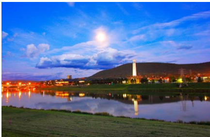
Corning - Ny