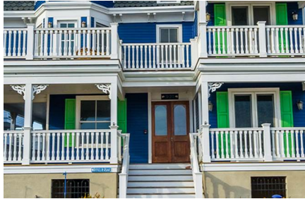
Cape May - Nj