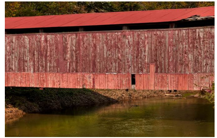
Lancaster - Pa