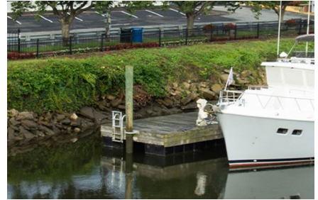
Lewes - De