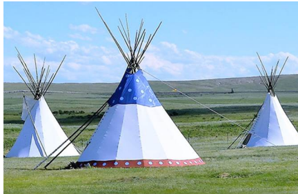
Browning - Mt