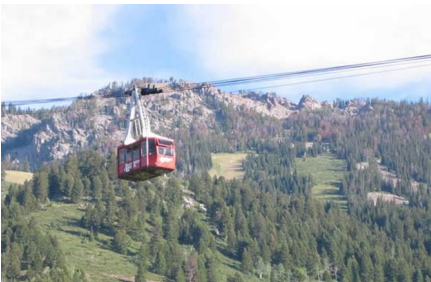
Jackson Hole - Wy