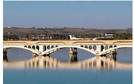
Great Falls - Mt