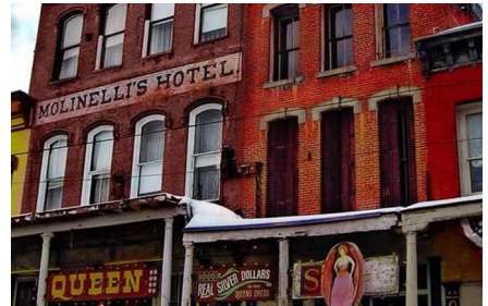
Virginia City - Mt