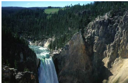
Yellowstone - Wy