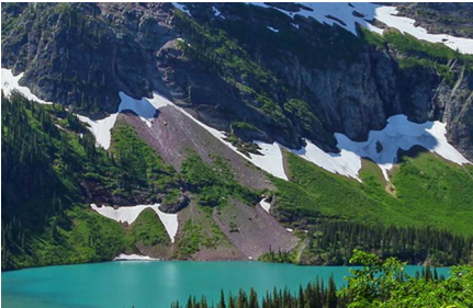
Parque Nacional de los Glaciares - Mt