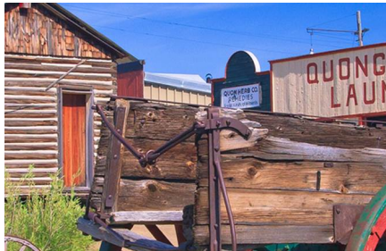
Butte - Mt