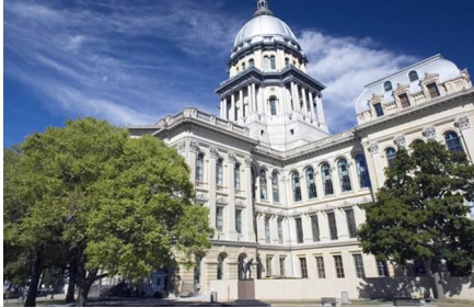
Springfield - Il