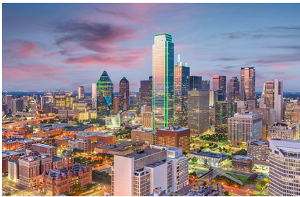
Dallas - Tx