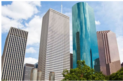
Houston - Tx