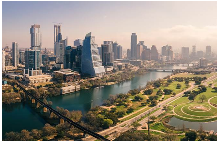
Austin - Tx