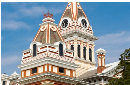
Pontiac - Il