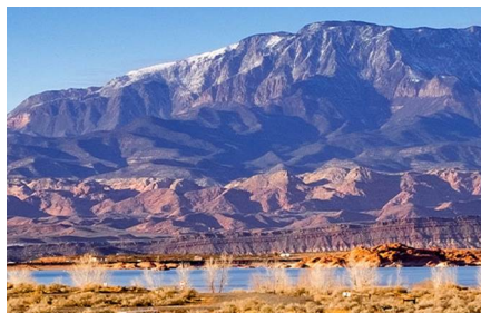
Hurricane - Ut