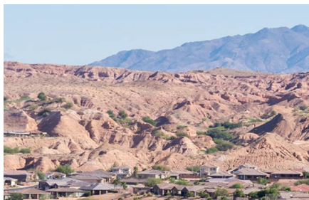
Mesquite - Nv