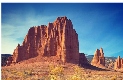
Torrey - Ut