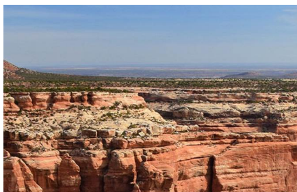
Blanding - Ut