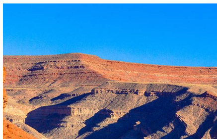
Mexican Hat - Ut