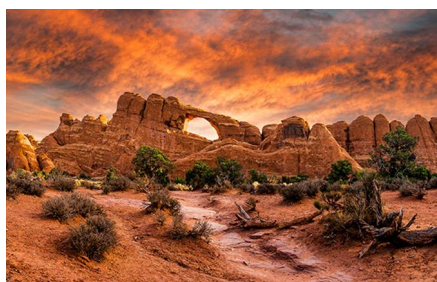
Moab - Ut