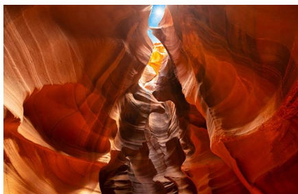
Page - Az