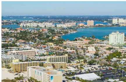
Saint Petersburg Beach - Fl