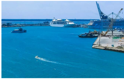
Palm Beach - FL