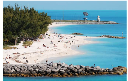
Key West - Fl