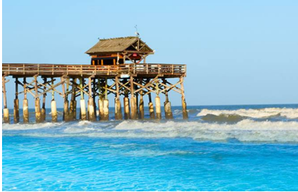
Boca Raton - FL