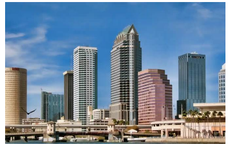
Tampa - Fl