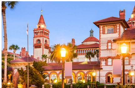
San Agustín - Fl