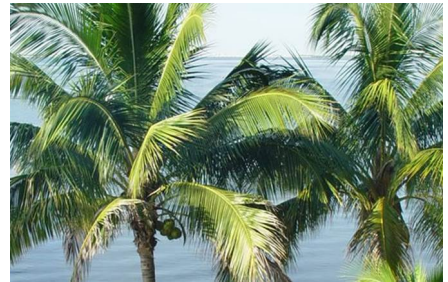
Fort Myers - Fl