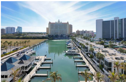
Sarasota - Fl