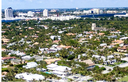
Fort Lauderdale - FL