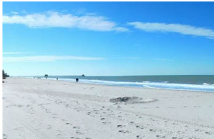
Naples - Fl