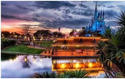
Cocoa Beach - FL