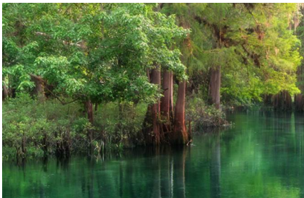
Crystal River - Fl