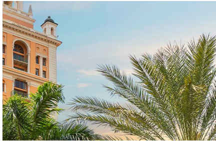
Coral Gables - Fl