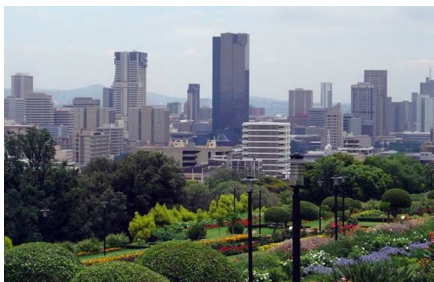
Ciudad del Cabo