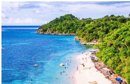
Isla de Borácay