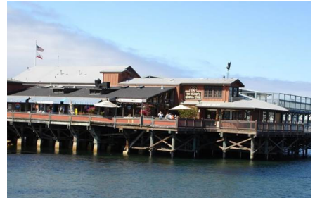
Monterey - Ca