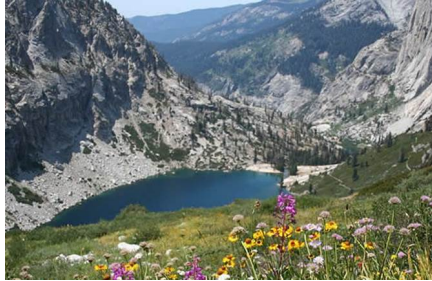
Parque Nacional Secuoya - Ca