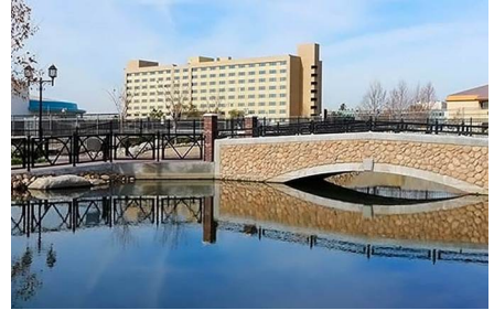
Bakersfield - Ca