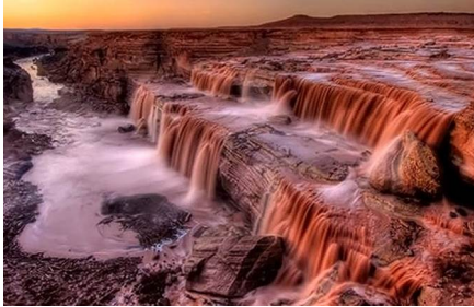
Flagstaff - Az