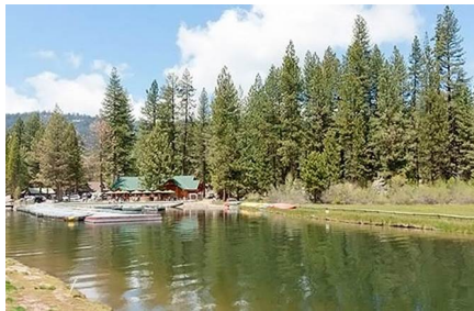
Fresno - Ca