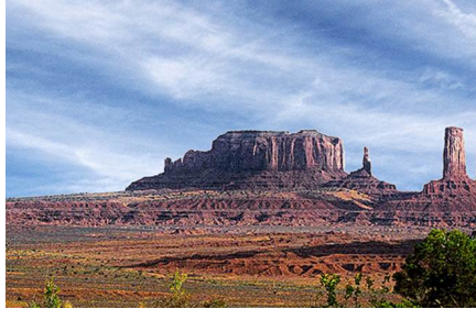
Valle de la Muerte - Ca