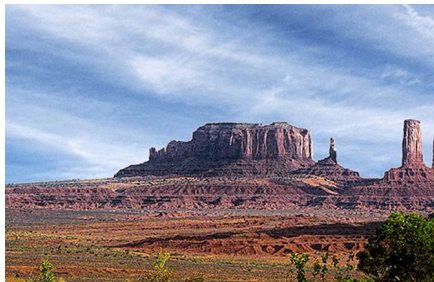
Valle de la Muerte - Ca