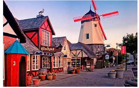
Solvang - Ca