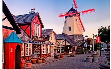
Solvang - Ca