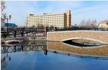
Bakersfield - Ca