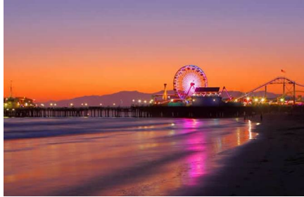
Santa Monica - Ca