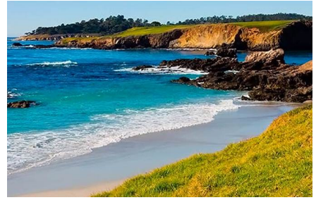
Carmel - Ny