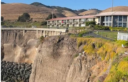
San Luis Obispo - Ca