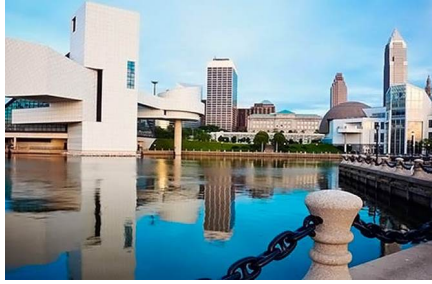
Cleveland - Oh