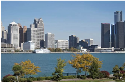
Detroit - Mi