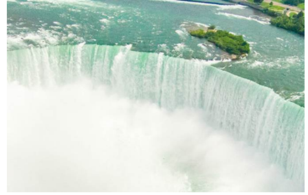
Cataratas Del Niágara