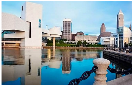
Cleveland - Oh