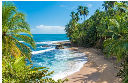
Puerto Viejo De Talamanca