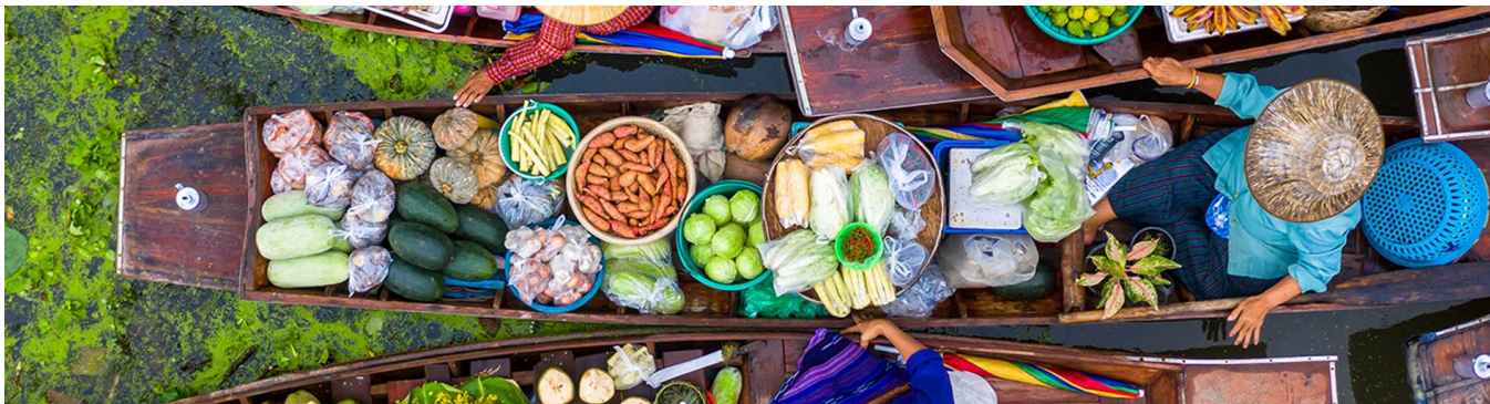
Tailandia, 13 Días · A tu aire con estancia en playa

Si existe un país que siempre fascina, que enamora por sus bellezas naturales, por su tradición histórica, por su cultura, sus gentes, ese es Tailandia. En este programa te brindamos la oportunidad de comprobarlo.