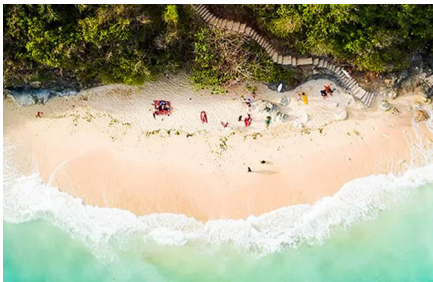
Provincia de Bali