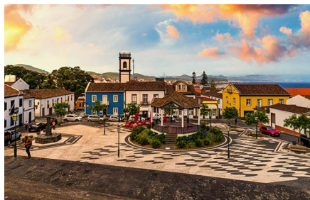
Isla de San Miguel