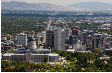
Salt Lake City - Ut