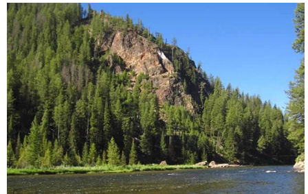
West Yellowstone - Mt