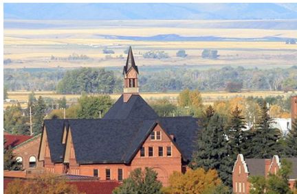
Bozeman - Mt