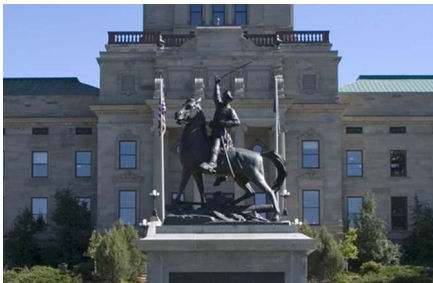
Helena - Mt