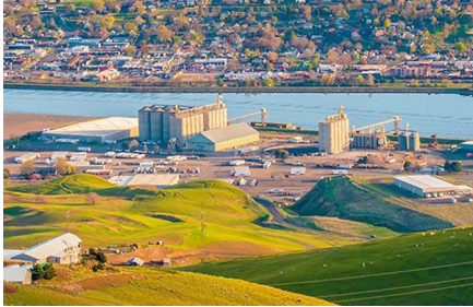
Lewiston - Id