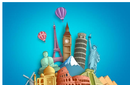
Isla de Lukuba